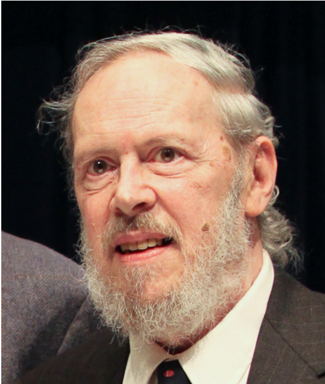
Dennis M. Ritchie, 1941–2011

Dieses Skript ist Dennis M. Ritchie gewidmet, ohne dessen Beiträge es nicht denkbar wäre. Dennis M. Ritchie hat nicht nur die Programmiersprache C entworfen und implementiert, sondern auch zusammen mit Ken Thompson Unix entwickelt. Mit C wurde erstmals eine höhere Programmiersprache statt Assembler für die Systemprogrammierung verwendet. Dennis Ritchie und seinen Kollegen gelang es bei Unix, die Betriebssystemschnittstellen und die Systemwerkzeuge in einem bis dahin unbekanntem Maß zu vereinfachen. Auf sie geht der Grundsatz zurück, dass jedes Werkzeug genau eine Aufgabe zu erfüllen habe und das möglichst gut.